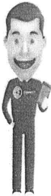
คุยกับพี่ปกป้อง Chatbot พร้อมให้บริการ

ทั้งนี้ ยังมี “พี่ปกป้อง” เป็น chatbot ที่ สคบ. ได้พัฒนาขึ้นมา เพื่อเป็นผู้ช่วยให้คำปรึกษาผู้บริโภค สามารถคอยสอบถามเรื่องด้านธุรกิจ ออกกำลังกาย, ด้านธุรกิจสายการบิน, ด้านธุรกิจโทรศัพท์เคลื่อนที่, ด้านธุรกิจให้เช่าซีดีรถยนต์, ธุรกิจการให้กู้ยืมเงิน, ช่องทางร้องเรียน, ความหมายและติดต่อหน่วยงาน, ด้านอสังหาฯ, ด้านโฆษณา, ด้านหมู่บ้านจัดสรร, ด้านธุรกิจประกันภัย, ด้านธุรกิจบัตรเครดิต, ด้านธุรกิจขาย, อาหารชุด, ด้านธุรกิจการให้เช่าที่อยู่อาศัย