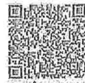
แบบสำรวจความคิดเห็น

กองสิ่งแวดล้อมท้องถิ่น กลุ่มงานสิ่งแวดล้อม โทร: ๐๒ ๒๔๑ ๙๐๐๐ ต่อ ๒๑๓๒