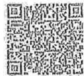
เครื่องมือการประเมินความเสี่ยง